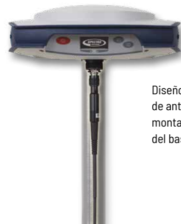
Diseño patentado de antena UHF montada dentro del bastón